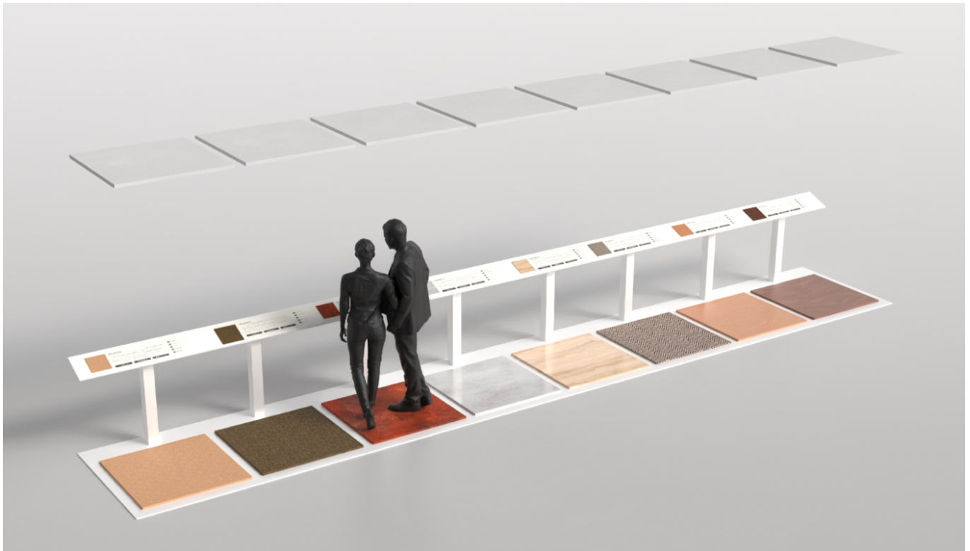
Bild oben: Konzept: 3D-Rendering des Materialpfads. Über den texturierten Kacheln befinden sich Richtlautsprecher.