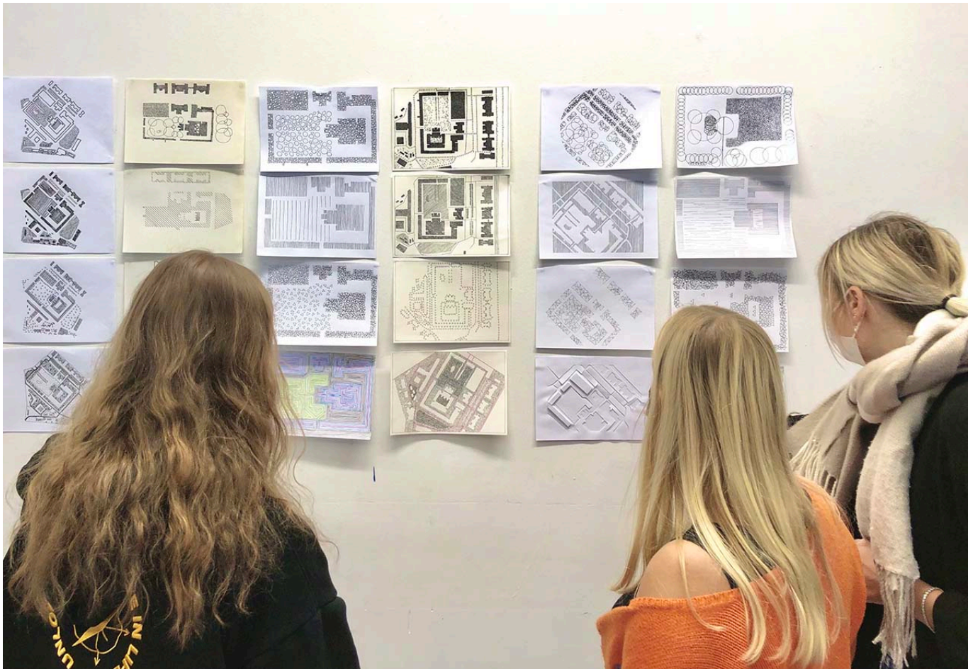
Bild oben: Studierende bei der Präsentation ihrer Arbeitsergebnisse. Die Arbeiten sind Teil der Dokubox.

From: https://wiki.ct-lab.info/ - Creative Technologies Lab | dokuWiki