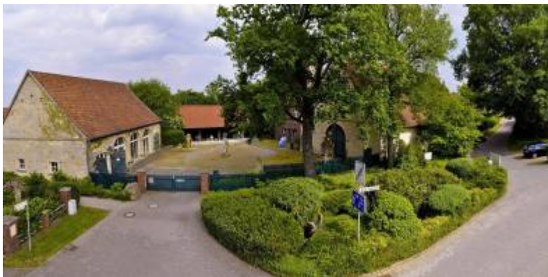
Baumberger Sandsteinmuseum, Havixbeck / Exkursion am 17. Okt. 2024

Im WiSe 2024/25 gibt es eine Kollaboration mit dem Baumberger-Sandstein Museum in Havixbeck.