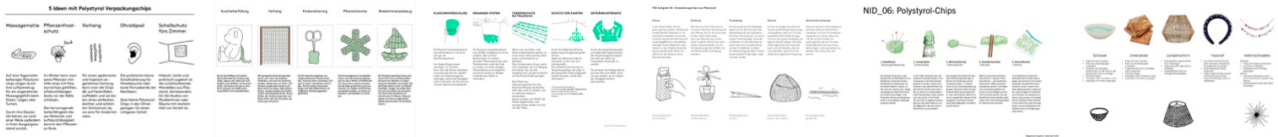
Beispiele aus vergangenen Semestern.

Ergänzen Sie Ihre Ansätze, wie im oberen Beispiel durch Ideenscribbles – also Handzeichnungen oder auch KI-Generierten Bildinhalten, die dabei helfen sollen den Kontext Ihres Ansatzes zu erklären.