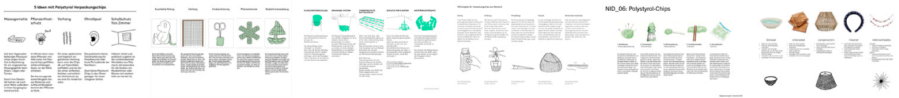
Beispiele aus vergangenen Semestern.

Ergänzen Sie Ihre Ansätze, wie im oberen Beispiel durch Ideenscribbles – also Handzeichnungen oder auch KI-Generierten Bildinhalten, die dabei helfen sollen den Kontext Ihres Ansatzes zu erklären.