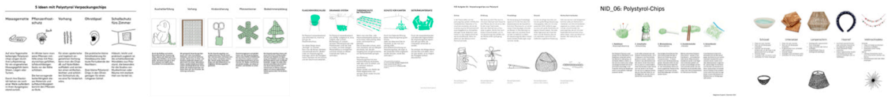
Beispiele aus vergangenen Semestern.

Ergänzen Sie Ihre Ansätze, wie im oberen Beispiel durch Ideenscribbles – also Handzeichnungen oder auch KI-Generierten Bildinhalten, die dabei helfen sollen den Kontext Ihres Ansatzes zu erklären.