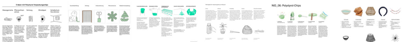
Beispiele aus vergangenen Semestern.

Ergänzen Sie Ihre Ansätze, wie im oberen Beispiel durch Ideenscribbles .