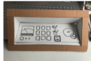
verschiedene Versionen für die schillerliche, um ende (3) für rechtsläufiger angepasst