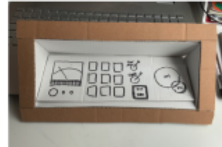
verschiedene Versionen für die schillerliche, um ende (3) für rechtsläufiger angepasst