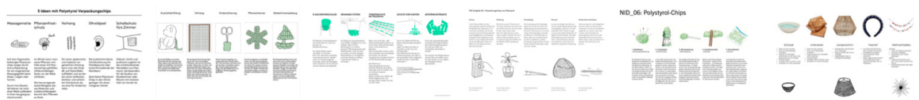
Beispiele aus vergangenen Semestern.

Ergänzen Sie Ihre Ansätze, wie im oberen Beispiel durch Ideenscribbles .