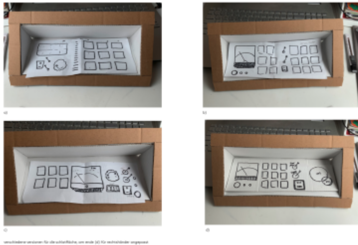
verschiedene Versionen für die Oberfläche, um eine (X) für nicht-fertige angepasst